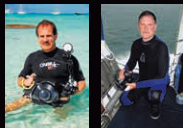
Текст и фото: Майкл Салварезза, Кристофер П. Уивер